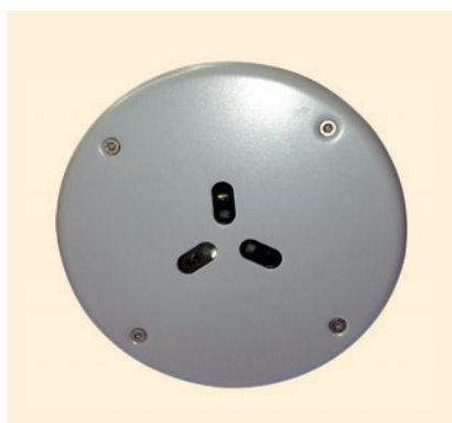
Рис. 1. Варианты исполнения бескамерных ИПДОТ

Но вот когда производители поняли, что этот тип извещателя необходимо совсем по-другому позиционировать, то телега сдвинулась с места. И ведь действительно оказалось, что в некоторых направлениях противопожарной защи-