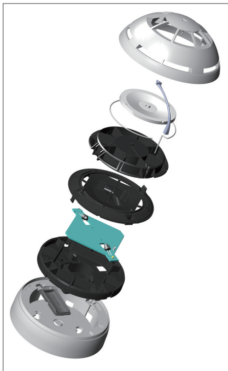
Рис. 1. Конструктивные элементы ИПДОТ российского производителя

В неадресных СПС выявление места ложного срабатывания – весьма трудозатратный про-